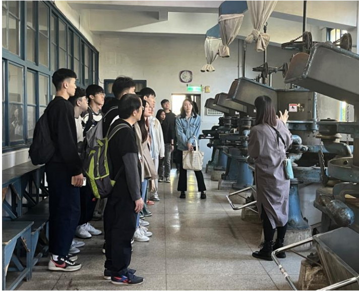
企業參訪 日月老茶廠 112.12.8